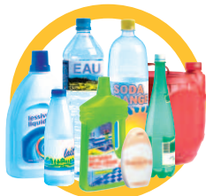
Bouteilles et flacons en plastique vidés