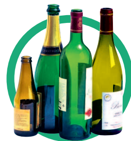
Bouteilles, bocaux et pots vides en vrac sans bouchon, ni capsule, ni couvercle