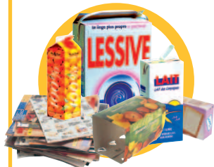
Papiers, cartons et briques alimentaires non déchetés