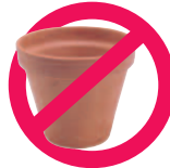
Pot en terre