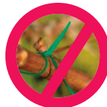
Liens plastique / métal