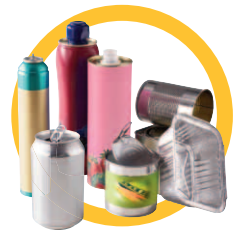
Conserves, canettes en métal, barquettes alu ...

Ne pas imbriquer ces emballages les uns dans les autres