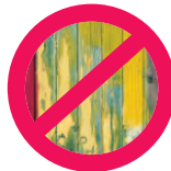
Bois peint ou vernis